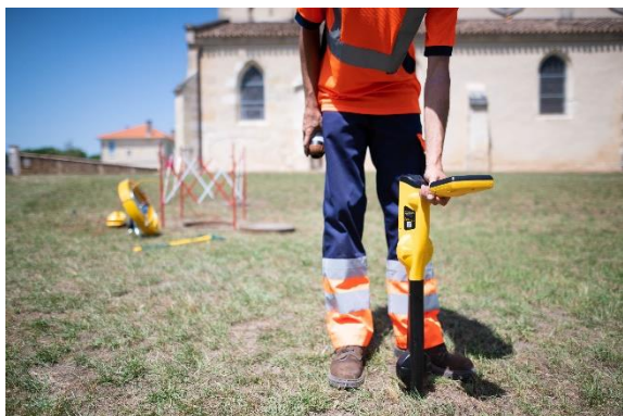
Figure 1 : Détecteur électromagnétique Vivax vLocPro3