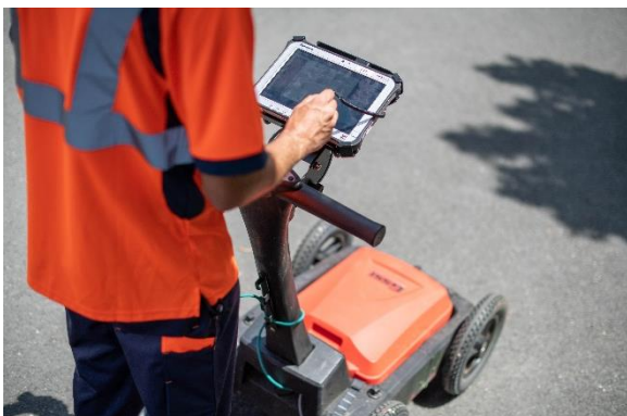
Figure 2 : Géoradar GSSI DF 300-800

La détection de champs électromagnétique permet de réceptionner en surface les signaux renvoyés par les différents matériaux conducteurs, à l'aide d'une induction de champs électromagnétique : câbles électrique ou téléphonique, conduite en acier ou en fonte ce qui représente environ 70 % du patrimoine enterré.